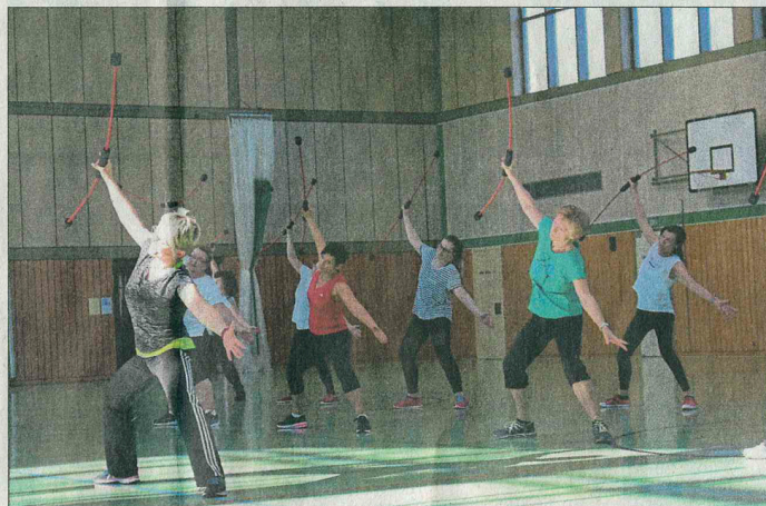
Vorstellung des Trainingsgerätes „Flexi-Bar“.

Den ganzen Nachmittag stand für die jungen Sportler nur noch die Freude an der Bewegung im Vordergrund. Kleinkindturnen mit Bausteinen oder Bodenturnen, akroba-