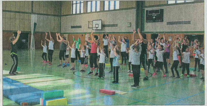
Fit für alle und mit allen.