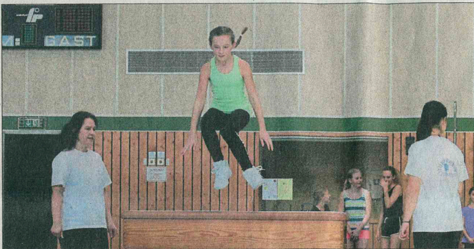
Große Turnkunst der Kleinen.