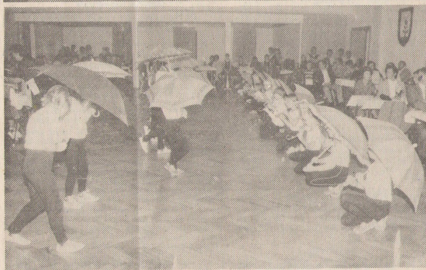
Zur Gestaltung des Programms trugen auch die Mädchengruppen mit dem Bändertanz und einem Schirmtanz bei. Da diese Vorführungen am Nachmittag im Stadion ausfielen, wurden sie am Abend in der Stadthalle gezeigt.